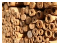
CAÑA DE BAMBU 240cm (18/20)mm